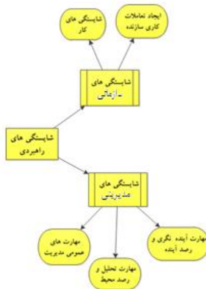
شکل ۱. مدل شبکه‌ای تحلیل مولفه‌های شایستگی‌های راهبردی

در بخش اول نتایج حاصل از تحلیل مولفه‌های شایستگی‌های راهبردی که با کمک نرم افزار Maxqda12 استخراج گردیده در شکل (۱) به صورت مدل شبکه‌ای تحلیل مولفه‌های شایستگی‌های راهبردی کار در سازمان نمایش داده شده است. مطابق این شکل شایستگی‌های راهبردی، دارای ابعاد " شایستگی سازمانی " و " شایستگی مدیریتی " است که شاخص‌های حاصل از پالایش کدهای هریک در شکل آورده شده است.