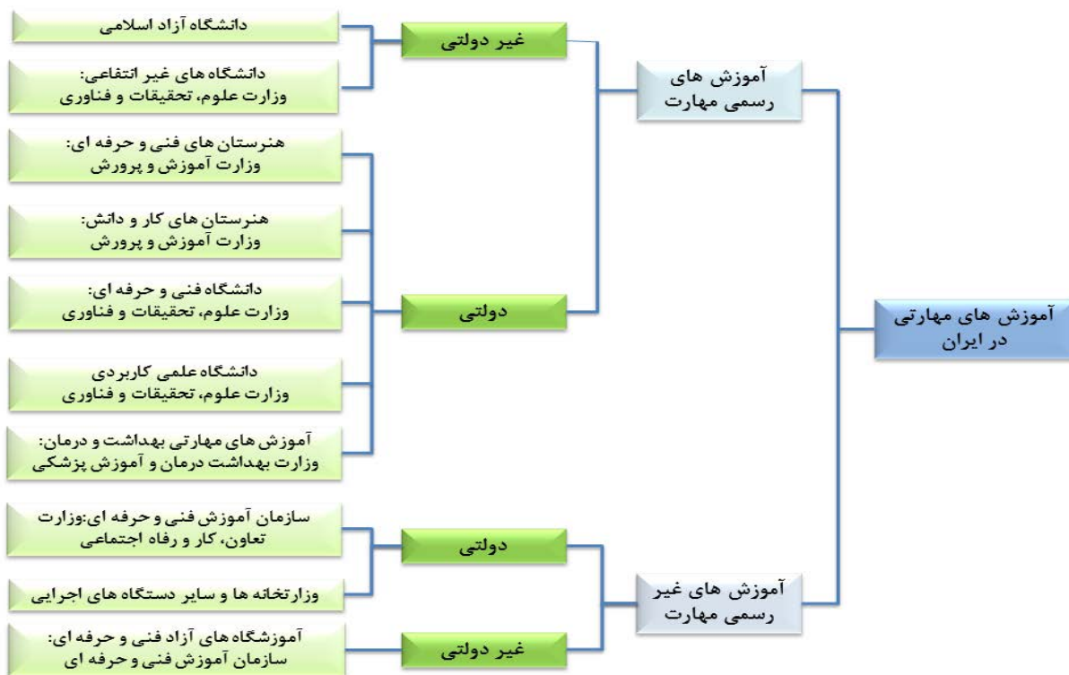
نمودار ۱- وضعیت آموزش‌های مهارتی در ایران