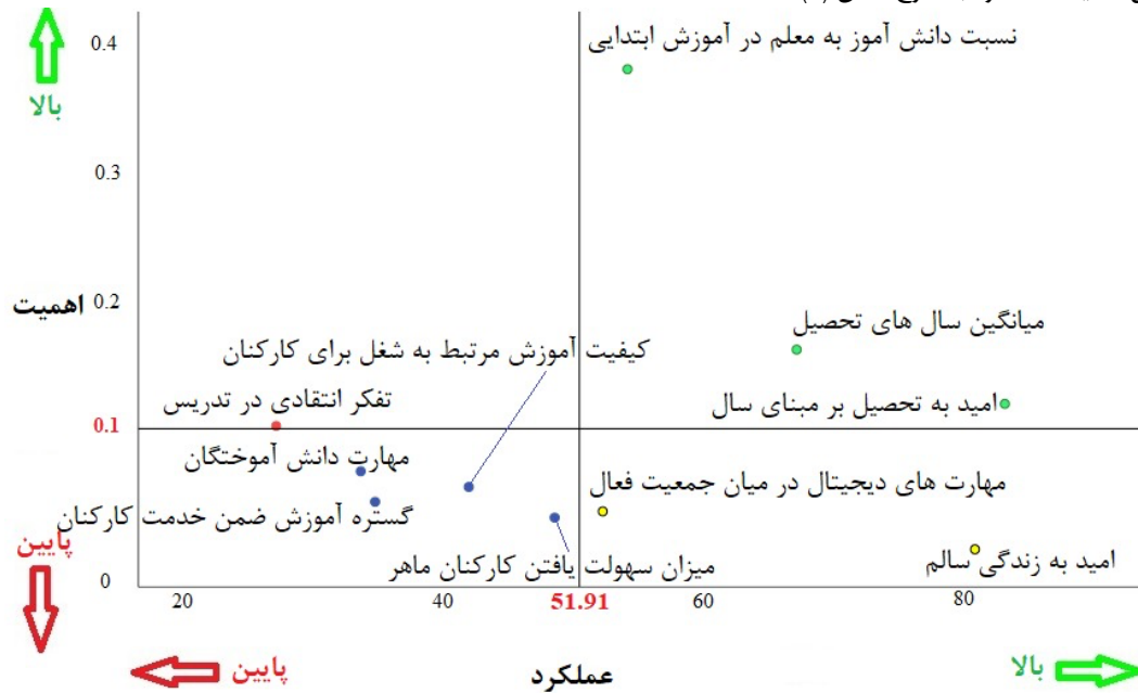
شکل ۳- ماتریس اهمیت-عملکرد شاخص‌های «سرمایه انسانی» ایران

برای اینکه اولویت‌های بهبود شاخص‌های «سرمایه انسانی» ایران مشخص گردد، می‌توان از نتایج ماتریس اهمیت-عملکرد با توجه به کشورهای منطقه استفاده کرد. در این ماتریس اوزان بدست آمده از روش آنتروپی میزان اهمیت شاخص‌ها را نشان می‌دهد و امتیاز نرمالسازی خطی (Hwang & Yoon, 1981: 30) به‌منزله مقیاس عملکردی در نظر گرفته می‌شود. نقطه برش در محور عملکرد میانگین هندسی امتیازات نرمالسازی شده ایران در شاخص‌ها و نقطه برش در محور اهمیت میانگین هندسی اوزان بدست آمده از روش آنتروپی را نمایندگی می‌کند. نتایج ماتریس اهمیت-عملکرد به شرح شکل (۳) است.